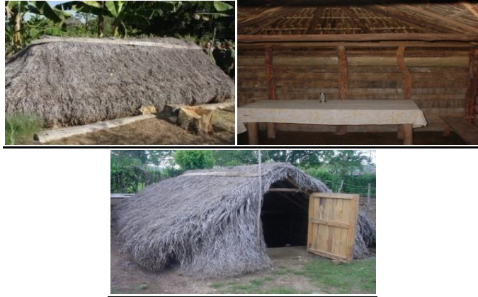
Figuras de Vara en Tierra.